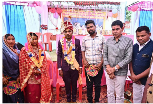
उन्होंने नव जीवन में प्रवेश करने वाले वर-वधु को आशीर्वाद देने के साथ-साथ प्रतिभावान बच्चों को सम्मानित भी किया। कार्यक्रम में निषाद समाज के प्रतिनिधि सहित बड़ी संख्या में ग्रामीणजन उपस्थित थे।