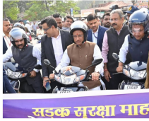
सड़क सुरक्षा माह

रायपुर: प्रदेश में मनाये जा रहे 36वें राष्ट्रीय सड़क सुरक्षा माह के दौरान आज मुख्यमंत्री श्री विष्णुदेव साय ने हेलमेट लगाकर बाईक चलाते हुए प्रदेशवासियों को हेलमेट लगाने और यातायात के नियमों के पालन करने के लिए आवाज उठाया। मुख्यमंत्री श्री साय ने आज राजधानी रायपुर के रोहणीपुरम गोल चौक पहुंचकर बाईक रैली में हिस्सा लिया। उन्होंने दोपहिया वाहन चालकों के साथ साथ चार पहिया वाहन चालकों से भी यातायात नियमों का पालन करने की अपील की। इस दौरान श्री